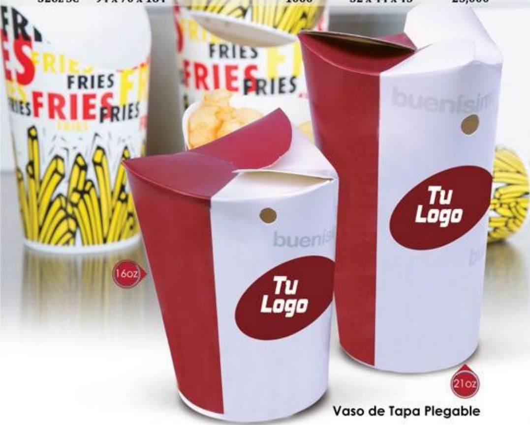
Vaso de Tapa Plegable